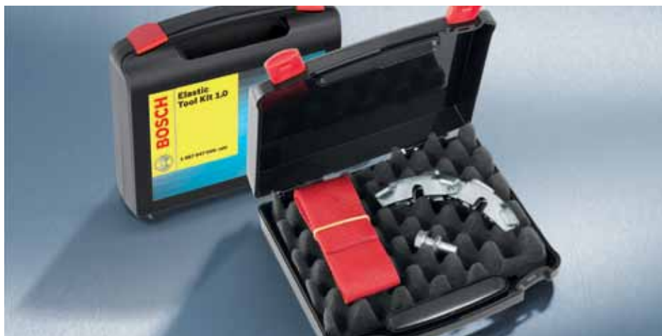
Elastic Tool Kit: uniwersalne narzędzie montażowe w praktycznej walizeczce.

Elastyczne paski wielorowkowe pracują w układach beznapińczowych. Z tego powodu do prawidłowego montażu i demontażu wymagane jest specjalne narzędzie. Wychodząc naprzeciw potrzebom, Bosch oddaje do dyspozycji warsztatów uniwersalne narzędzie Elastic Tool Kit, pasujące do niemal wszystkich popularnych modeli samochodów. Teraz możliwa