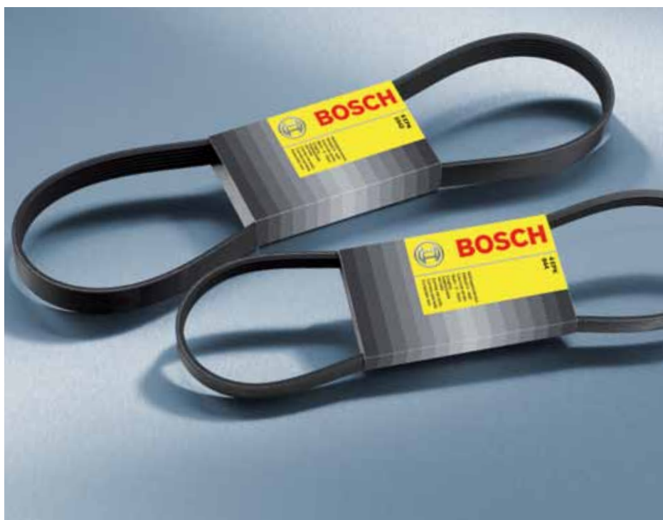
Elastyczne paski wielorowkowe Bosch do samochodów osobowych od firmy Bosch

Połączenie najbardziej nowoczesnych, syntetycznych odmian kauczuku oraz wyjątkowo odpornych na przeciążenie, zaawansowanych technologicznie włókien o optymalnej elastyczności