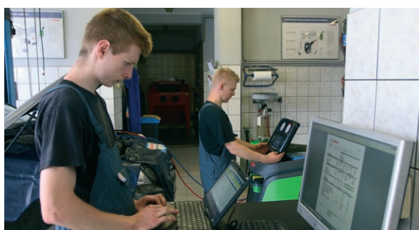
Na wyposażeniu serwisu są m.in. urządzenia diagnostyczne KTS 540, diagnoskop silnikowy FSA, urządzenie do serwisu klimatyzacji z nowym czynnikiem R1234yf