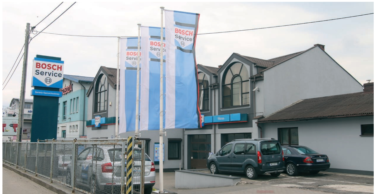
Warsztat mieści się przy ul. Sobieskiego w Rumi (główna ulica tego miasta) wyprowadzającej ruch z obwodnicy Trójmiasta na północ)