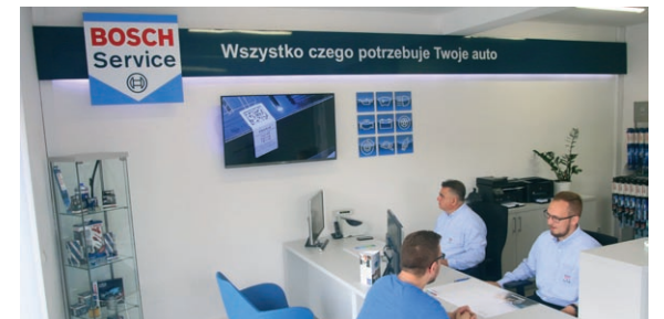
Biuro obsługi klienta to jedna z wizytówek każdego warsztatu. W Rumi do tego miejsca przywiązują dużą wagę

ale nasze relacje nie mają takiego charakteru. Odwiedzamy się nawzajem, służymy sobie radą, podpowiadamy, rozmawiamy o różnych rozwiązaniach. Podobne relacje partnerskie mamy z zarządzającymi siecią Bosch Car Service – opowiada właściciel. – Fakt, że Bosch dba, pilnuje i weryfikuje jakość poszczególnych serwisów jest pozytywny. Wszystkim nam zależy, by poziom był jak najwyższy. Lepiej przecież współpracować z kolegami, którzy też dbają o jakość swoich punktów – opowiada.